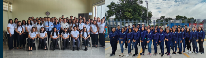
DIDEDUC GUATEMALA OCCIDENTE »»» GRUPO 7

Para el segundo semestre del año 2023, aproximadamente 838 estudiantes que cursan el octavo ciclo de la carrera de Contaduría Pública y Auditoría de la Facultad de Ciencias Económicas de la Universidad de San Carlos de Guatemala se encuentran realizando su Práctica Profesional abordando el tema "Evaluación del Control Interno a la Ejecución Presupuestaria del Programa de Alimentación Escolar en las direcciones departamentales del Ministerio de Educación" , visitando para el efecto 17 direcciones ubicadas tanto en la capital como en el interior del país.