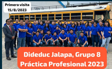
Primera visita 15/8/2023

Dicho Programa tiene por objeto contribuir al crecimiento y desarrollo de los niños y adolescentes en edad escolar, enfocándose en el aprendizaje, el rendimiento escolar y la formación de hábitos alimenticios saludables de los estudiantes.