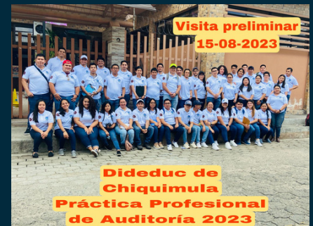
DIDEDUC CHIQUIMULA »»» GRUPO 4

La alimentación escolar debe ser regulada de manera integral, de tal forma que permita un monitoreo y una fiscalización adecuada de los programas de apoyo establecidos, sus beneficiarios, resultados y recursos que el Estado brinda a la niñez dentro del sistema educativo en el marco de una gestión participativa y democrática donde los beneficiarios y la comunidad en general se incorporan de manera activa y consciente al seguimiento, evaluación y control de la ejecución del Programa, como una expresión concreta del ejercicio de la auditoría social. (Congreso de la República de Guatemala, 2017)