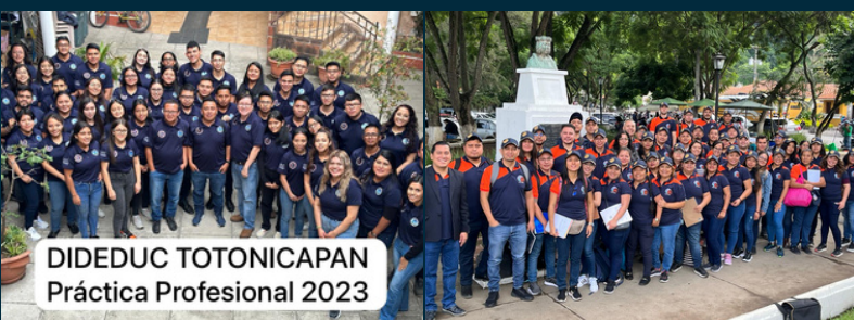
DIDEDUC TOTONICAPAN Práctica Profesional 2023