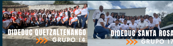
DIDEDUC QUETZALTENANGO »»» GRUPO 14