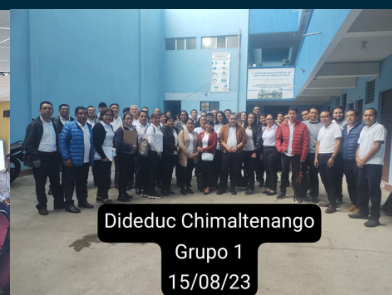
Dideduc Chimaltenango Grupo 1 15/08/23