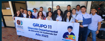
DIDEDUC GUATEMALA SUR »»» GRUPO 11

La Evaluación del Control Interno a la Ejecución Presupuestaria del Programa de Alimentación Escolar, en las Direcciones Departamentales del Ministerio de Educación, constituye un pilar fundamental en la gestión institucional, debido a que en el informe que se presentará se propondrán oportunidades de mejora que contribuyan al fortalecimiento de la eficiencia, eficacia y economía en la administración de los recursos.